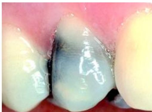
Verkleuring door grijze of zwarte vulling