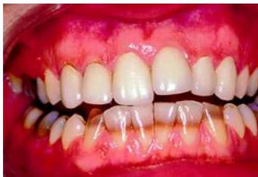
Verkleuring door ontwikkelingsstoornissen in de tandkiem