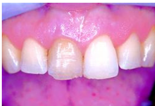
Verkleuring door een dode tand