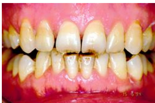
Verkleuring door verouderingsproces