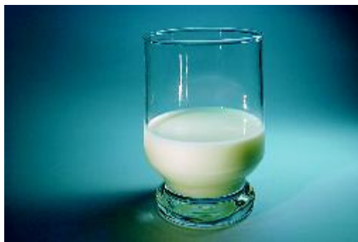
Bewaar de tand in melk