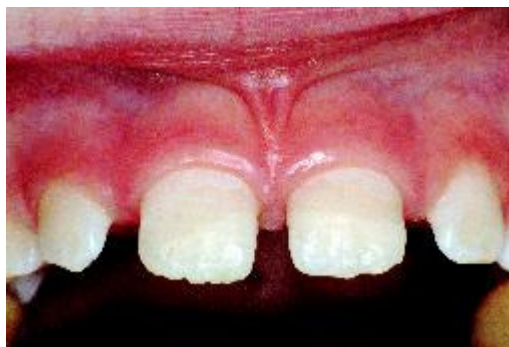
... en hersteld