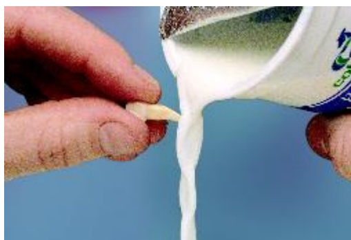
Spoel de tand af met melk