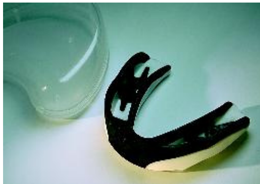
Gebitsbeschermer, te koop in sportwinkels

beschermen daarom onvoldoende. Het beste werkt de gebitsbeschermer die precies op maat is gemaakt door uw tandarts.