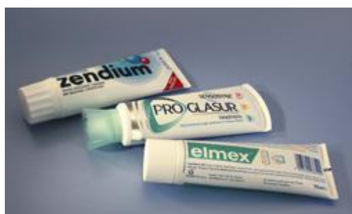
Gebruik een niet-schurende tandpasta