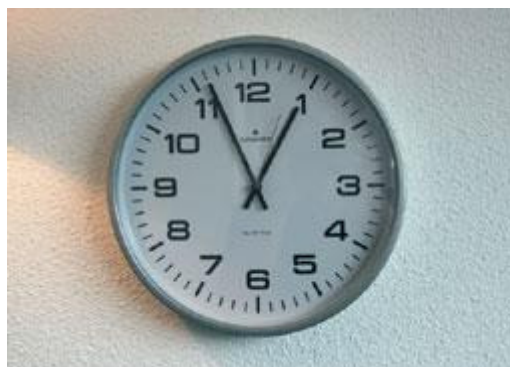
Eet of drink één uur voor het tandenpoetsen geen zure producten

Het oppervlak van tanden en kiezen wordt zachter door de inwerking van zuur. Als u direct na het eten of drinken van zuur uw tanden poetst, kunt u de glazuurlaag gemakkelijk wegpoetsen. Dan slijt uw gebit dus nog sneller.