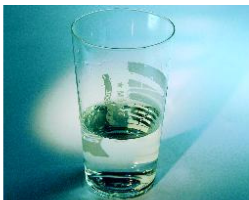
Neutraliseer zuur met water, melk of kaas