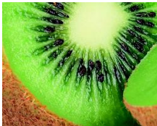
... in kiwi's en in citrusvruchten