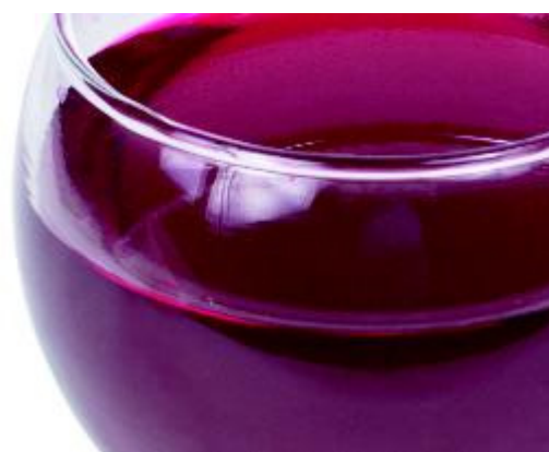
Zuur zit onder andere in wijn ...

Zuren in voeding en dranken kunnen tanderosie veroorzaken. Zuur zit onder andere in (sinaas) appels, citroenen, grapefruit, kiwi's, vruchtensappen, (light)frisdranken (ook ijsthee), wijn en bijvoorbeeld breezers. Tanderosie is een sluipend proces dat niet gemakkelijk te herstellen is. Het gaat niet alleen om hoeveél zure producten u eet en drinkt. Het gaat vooral om hoe vaak, hoe lang, de tijdstippen en de manier waarop u dat doet. Wanneer tanderosie niet wordt bestreden, kunnen zuren het tandglazuur en vervolgens zelfs het blootliggende tandbeen oplossen. Zie verder wat veroorzaakt tanderosie?