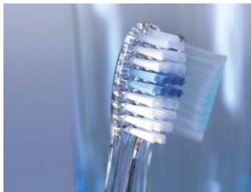
Gebruik een zachte tandenborstel