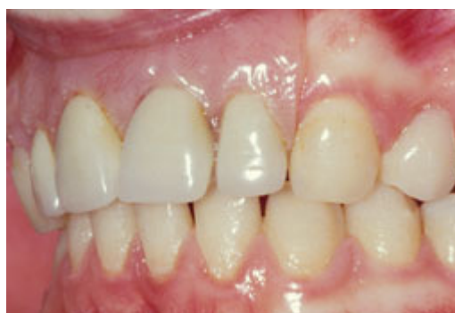
Plaatprothese van opzij