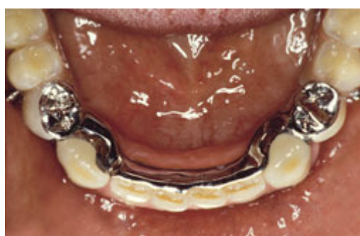
Frameprothese met verankering op kronen