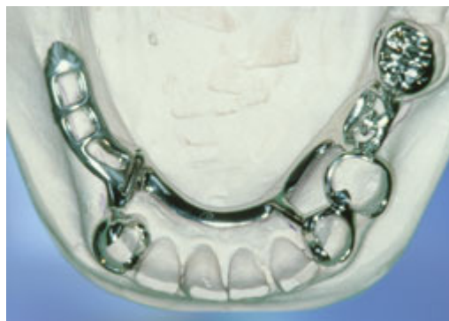
Frameprothese in wording op een gipsmodel, zonder kunsttanden en -kiezen

De frameprothese is gemaakt van metaal. Op het metaal is een tandvleeskleurige kunsthars aangebracht. Daarop zitten de kunsttanden of -kiezen. De frameprothese rust vooral op een deel van de overgebleven tanden of kiezen. Afhankelijk van het ontwerp rust de frameprothese ook meer of minder op het slijmvlies. De tandarts kan de frameprothese op twee manieren bevestigen. Of met metalen ankertjes die om enkele tanden of kiezen klemmen of met een soort slotje. Bij een slotje wordt de ene kant vastgemaakt aan een kroon, tand of kies en de andere kant zit vast aan de frameprothese. De frameprothese kunt u op die manier in het slotje schuiven. Het slotje zit doorgaans aan de binnenkant van de tanden en kiezen en is dus niet vanaf de buitenkant zichtbaar. Ankertjes zijn vaak wel enigszins zichtbaar.