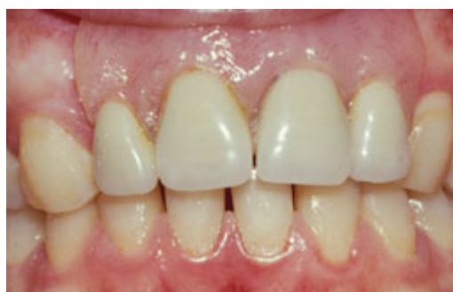
Plaatprothese van voren

De plaatprothese is gemaakt van een roze, tandvleeskleurige kunsthars. Daarin zijn de kunsttanden en kiezen verankerd. De gehele plaatprothese rust op het slijmvlies van de mond. Deze zit eventueel met ankertjes vast aan overgebleven tanden of kiezen.