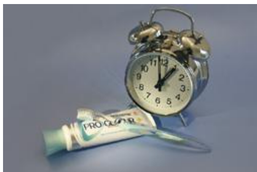
Gebruik geen zure producten één uur voor het tandenpoetsen