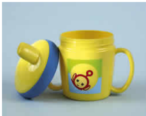
Laat uw kind vanaf 9 maanden uit een beker drinken

Vaak sabbelen aan een zuigflesje of anti-lekbeker met bijvoorbeeld vruchtensap, siroop, drinkyoghurt en andere melkproducten kan het gebit aantasten. Omdat het gebit langdurig met suikers in aanraking komt, is er een grote kans op het ontstaan van zogenoemde zuigflescariës. De kans hierop is kleiner als kinderen hun zoete drankjes in één keer opdrinken. Laat daarom uw kind vanaf negen maanden uit een beker zonder tuit drinken in plaats van uit een zuigflesje of anti-lekbeker. Gebruik een tuitbeker eventueel eerst als tussenstap. 's Avonds en 's nachts is het drinken uit een zuigflesje met zoete inhoud extra schadelijk. 's Nachts kan het speeksel de zuuraanvallen op het gebit vrijwel niet herstellen. Het ('s nachts) drinken van water uit een zuigflesje is overigens niet schadelijk.