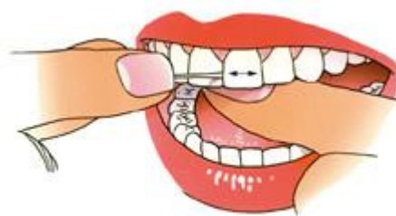
Breng de draad met gedoseerde kracht door het contactpunt

2. Breng met behulp van uw duimen en wijsvingers de draad met gedoseerde kracht en heen-en-weergaande bewegingen door het punt waar de tanden of kiezen elkaar raken (contactpunt). Doe dit voorzichtig en voorkom doorschieten.