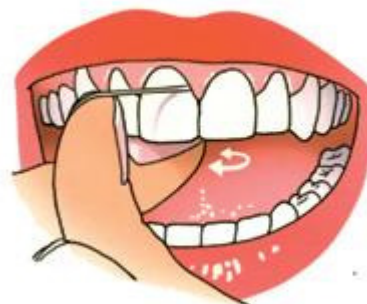
Trek de draad strak om de tand of kies

3. Trek de draad na het contactpunt strak om de tand of kies. Breng de draad onder het tandvlees totdat u weerstand voelt. Het mag geen pijn doen. Haal de draad dan, terwijl die contact houdt met de zijkant van de tand of kies, met korte heen-en-weergaande bewegingen terug tot het contactpunt.