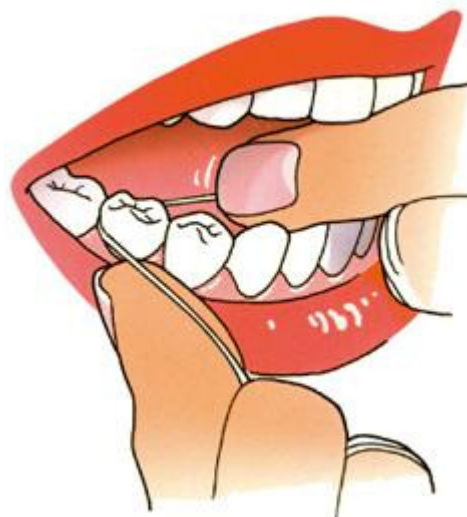
Gebruik voor iedere tussenruimte een nieuw stukje flossdraad

6. Ga door naar de volgende tand of kies. Gebruik voor iedere tussenruimte steeds een nieuw stukje flossdraad.