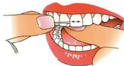
Haal de draad met een zagende beweging door het contactpunt terug

5. Breng de flossdraad dan met een zagende beweging door het contactpunt en haal hem terug.