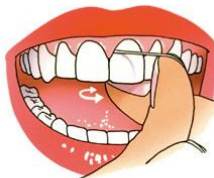
Breng de draad voorzichtig onder het tandvlees

4. Trek de draad nu strak om de aangrenzende zijkant van de tand of kies. Breng de draad weer voorzichtig onder het tandvlees. Stop als u weerstand voelt. Breng de draad, terwijl die contact houdt met de zijkant van de tand of kies, met korte heen-en-weergaande bewegingen terug tot het contactpunt.