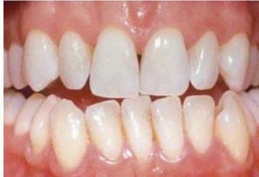
Resultaat na tien dagen bleken met de thuisbleekmethode onder begeleiding van de tandarts

De lengte van een bleekbehandeling hangt af van de bleekmethode. Bij de thuisbleekmethode duurt het meestal twee weken voordat u een gewenst resultaat bereikt.