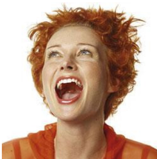
Het bleekresultaat verschilt voor iedereen

Het bleekresultaat verschilt voor iedereen. De basiskleur van uw tandbeen bepaalt voor een belangrijk deel het uiteindelijke resultaat. En die basiskleur is bij iedereen anders. Het bleekresultaat is soms niet blijvend. In een aantal gevallen komt de verkleuring na een paar jaar weer terug. De vorming van tandbeen gaat namelijk gewoon door. Ook gebleekte tanden zullen, net zoals niet-gebleekte tanden, op den duur verkleuren door veroudering. Dit proces gaat sneller als u rookt of bepaalde voedingsstoffen veel gebruikt. Het effect van langdurig of herhaald bleken op het tandweefsel is niet helemaal bekend.