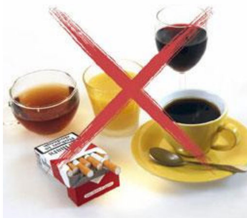
Tijdens de behandeling met de bleeklepel is het gebruik van deze producten af te raden

Door het bleken, wordt het glazuur van de tanden en kiezen iets poreuzer. Dat is tijdelijk. Het glazuur herstelt zich weer. Tijdens de behandeling met de bleeklepel kunnen bepaalde etenswaren en dranken het resultaat nadelig beïnvloeden. Voorbeelden daarvan zijn koffie, thee, rode wijn, koolzuurhoudende frisdranken, citrusvruchtensap en kleurstof bevattende etenswaren (zoals vruchtenjam). Tijdens de behandeling is het gebruik van deze producten, evenals roken, af te raden.