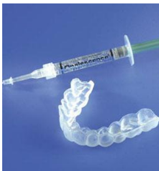
Van de tandarts of mondhygiënist krijgt u de doorzichtige bleeklepel en de gel met de blekende werking mee naar huis

Egale, niet te ernstige verkleuringen kunnen van buitenaf worden gebleekt. Dat gebeurt met behulp van een bleeklepel. Eerst maakt uw