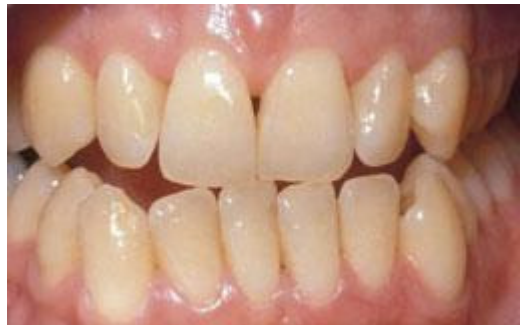
Voor het bleken